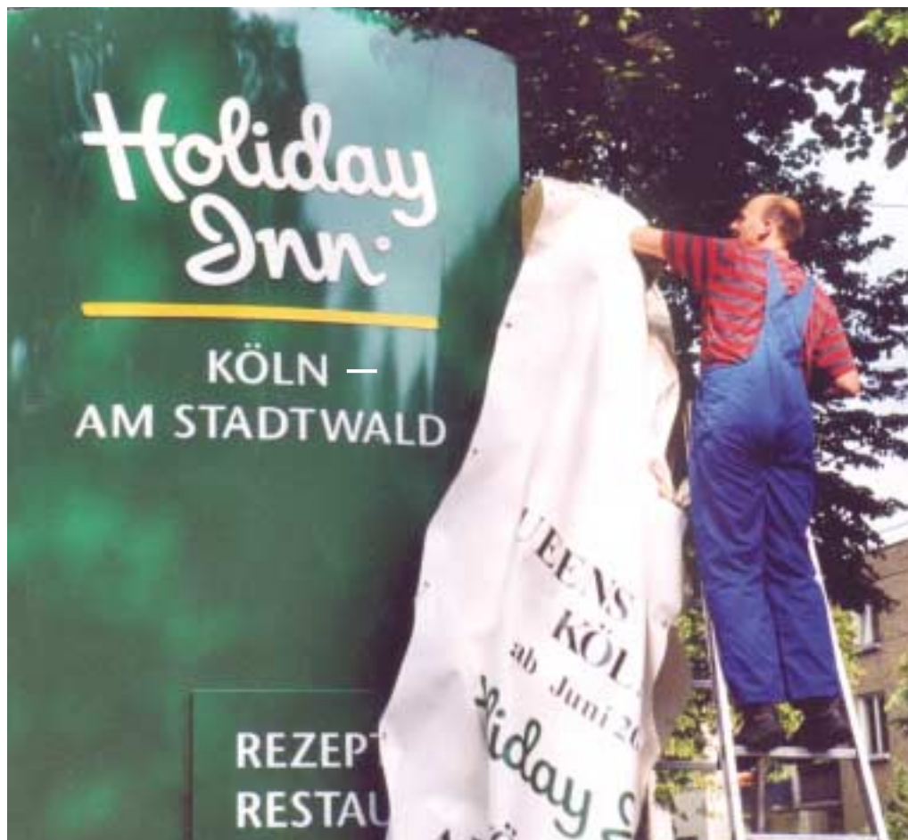
Das war für die Mitarbeiter des bisherigen Queens Hotels in Köln ein großer Moment

Queens Times wird regelmäßig über Neuigkeiten der InterContinental Hotels Group berichten.